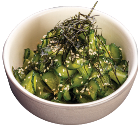
ОГУРЦЫ С СОУСОМ ПОНЗУ