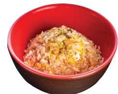
РИС С КУРИЦЕЙ 250 г