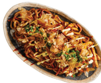
ЯКИСОБА С КУРИЦЕЙ 250 г