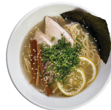
СИО 650 мл

Лёгкий бульон, лапша, курица, бамбук, красный и зелёный лук, нори, лимон