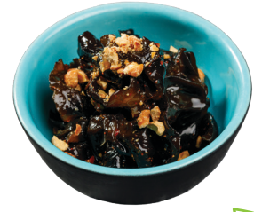
ГРИБЫ МУЭР В КИСЛО-СЛАДКОМ СОУСЕ